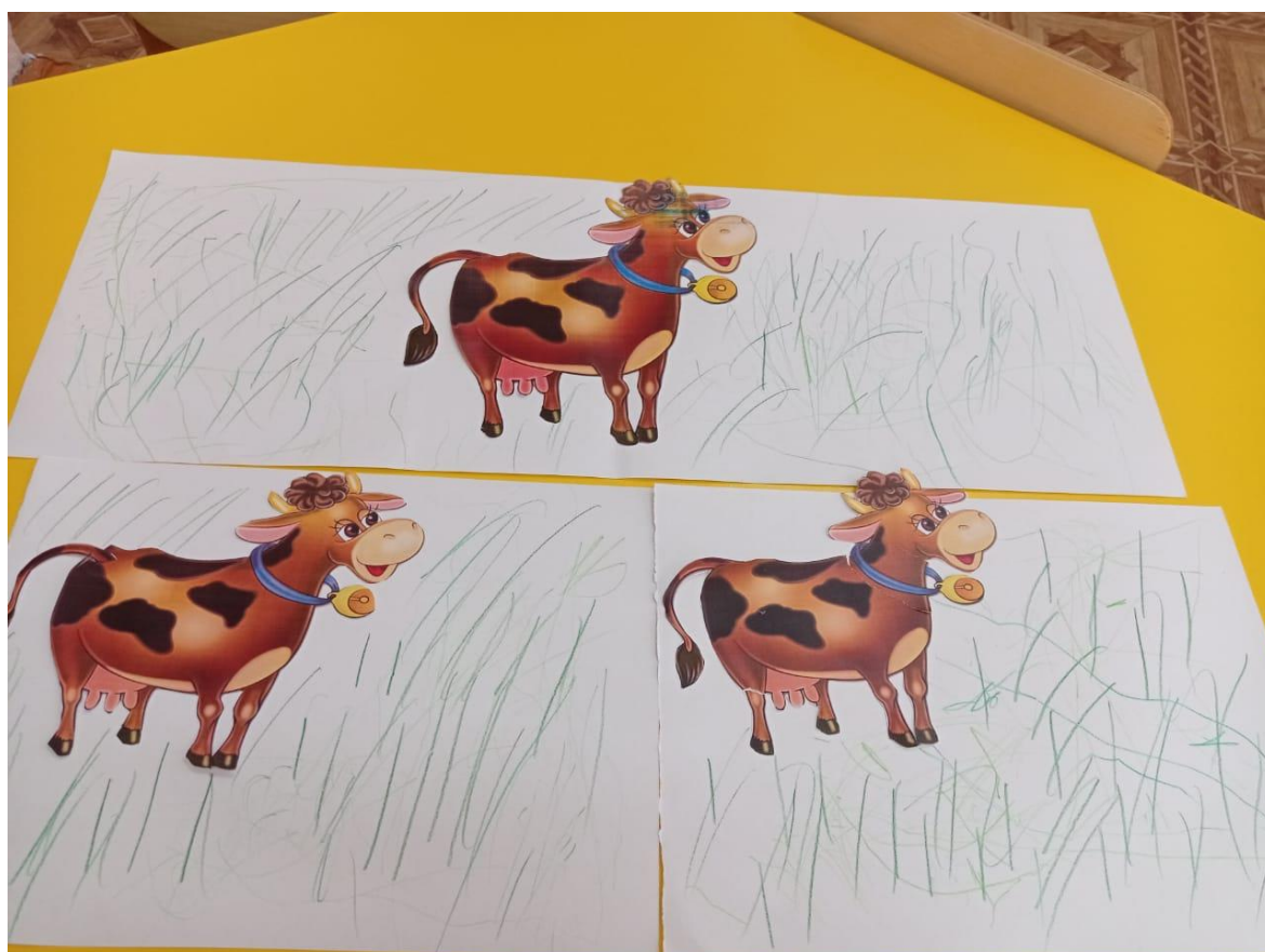
Травка для коровы